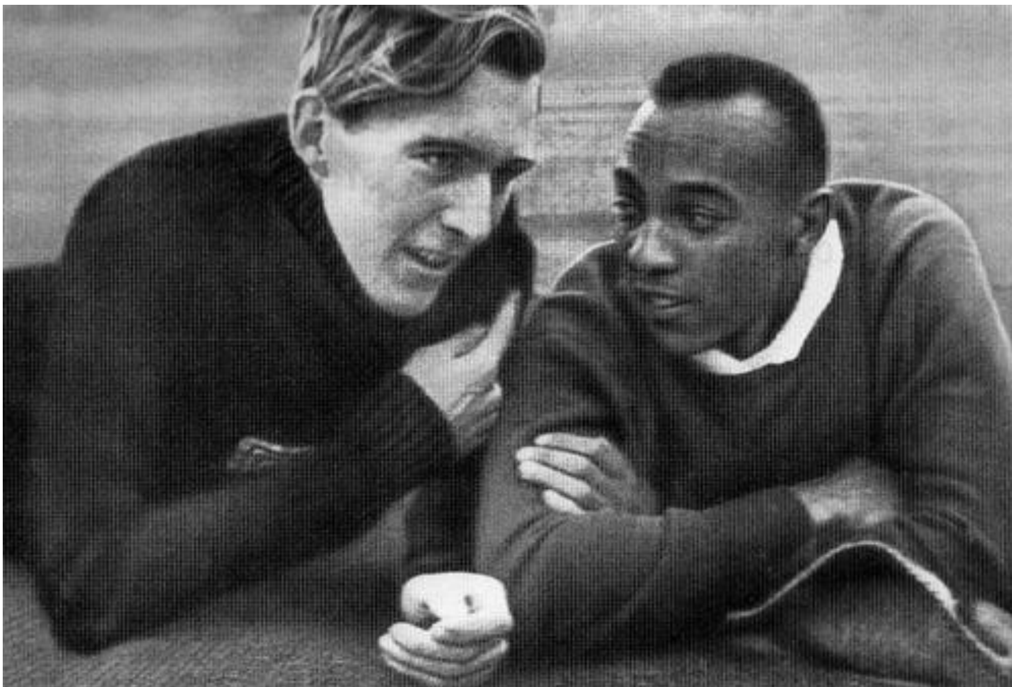
Лутц Лонг и Джесси Оуэнс