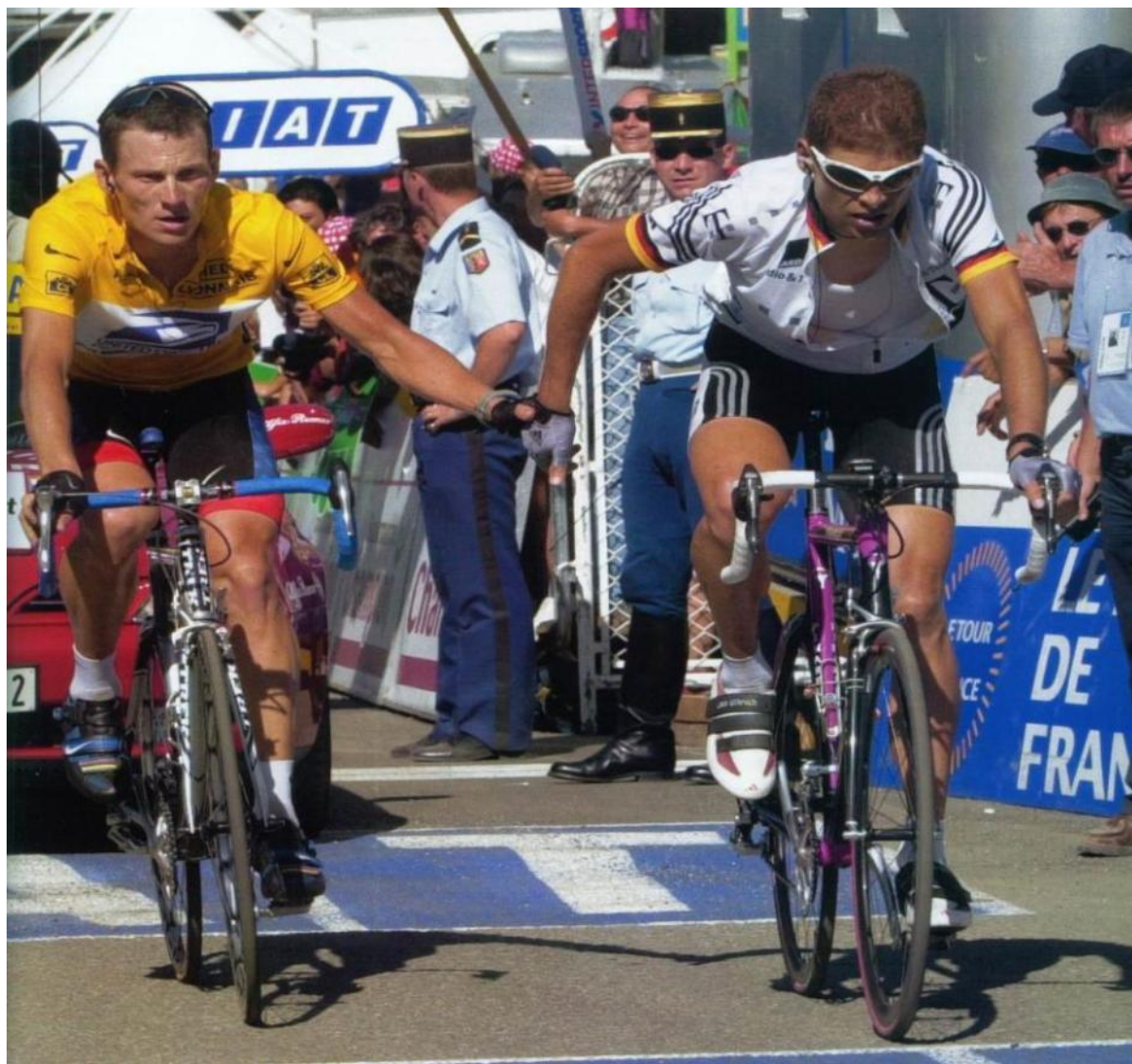
Лэнс Армстронг и Ян Ульрих